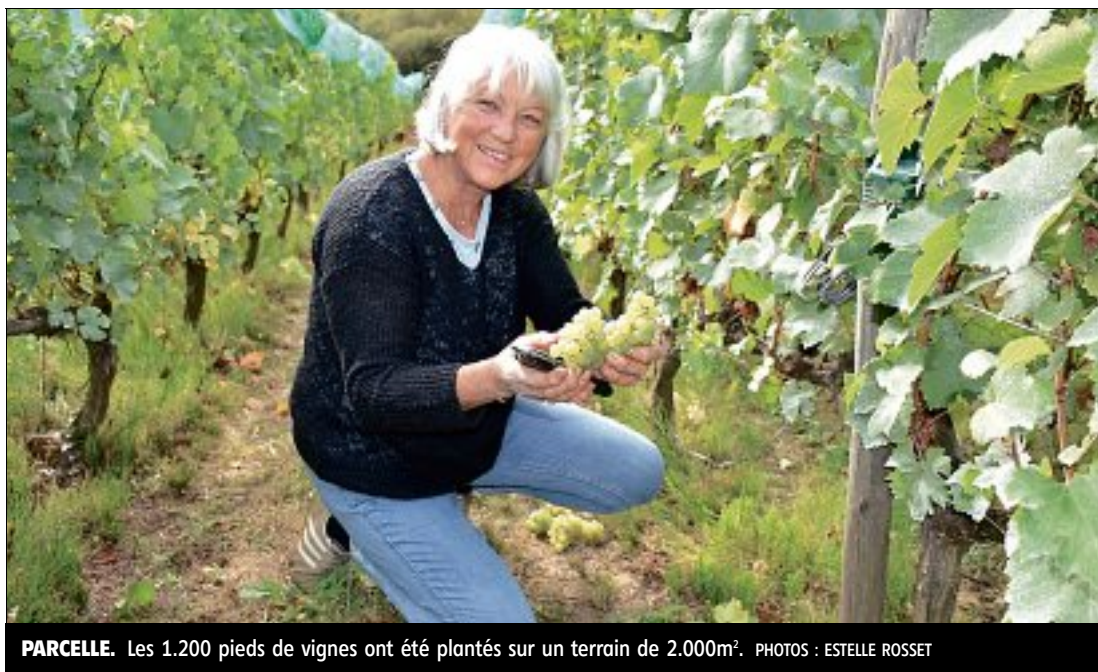
PARCELLE. Les 1.200 pieds de vignes ont été plantés sur un terrain de 2.000m 2 .

Tous passionnés, c'est avec une joie non dissimulée qu'ils prennent les sécateurs, pour couper le raisin, qui laisse présager un très bon vin cette année. Les grappes sont belles, nombreuses, et sucrées. « C'est un vrai plaisir d'être ici, de suivre tout le processus de fabrication du vin, avance Matine, re-