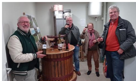
RENCONTRE AMICALE DU 25 MARS